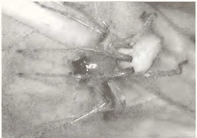
Abb. 1: Weibchen von Cheiracanthium mildei . Aufnahme aus Aurisina, Südtirol. Foto: B. Thaler-Knoflach, 2.7.1993.

Die Zahl der mitteleuropäischen Spinnenarten, deren Biss beim Menschen nennenswerte Folgen verursachen kann, wird zwischen einer und sieben angegeben (SCHMIDT 1987, 1993, SACHER 1990, FOELIX 1996, LEMKE 2005). Am bekanntesten und berüchtigtsten ist zweifellos der Ammen-Dornfinger Cheiracanthium punctatorium (Villers, 1789). Seit der ersten Meldung dieser Art für Deutschland durch BERTKAU (1891), die auch gleich mit der Schilderung eines Bisses mit „ungemein heftig brennender“ Schmerzwirkung einherging, ist es nach einzelnen verbürgten Vorfällen regelmäßig zu Wellen von Panik und Hysterie gekommen, die von Pressemeldungen weiter angefacht wurden. So geriet der Dornfinger nach Bissverletzungen in Rheinhessen bereits 1979 in „bisher nicht bekanntem Maße ins Interesse der Öffentlichkeit“ (GRASSHOFF 1979). Unvergleichlich ist jedoch die Dornfinger-Hysterie in Österreich im